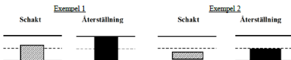
Figur 2. Exempel på schaktning utförd av entreprenör och den efterföljande återställningsgraden utförd av kommunen.